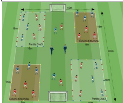
Soluzione Gioco 1